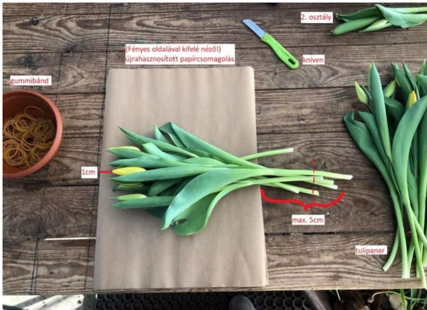
(a képen látható csokor a kép készítése után ki lett javítva 😊)

Ami azt illeti a február legnagyobb részét tulipáncsokrok készítésével töltöttem. A csokrok kötése is precíz, pontos szabályokkal jár, ez a -tapasztalataim szerint- a dán kultúra és gondolkodásmód egyik nagy alapköve. Precízitás.